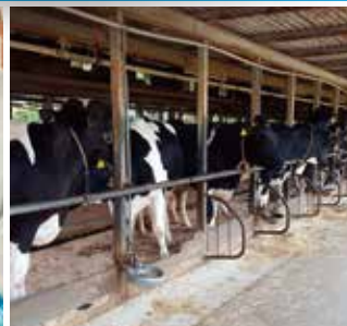
畜産・農業施設など