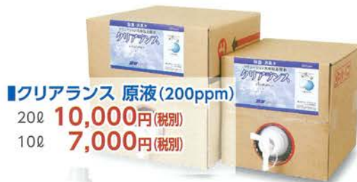
■クリアランス 原液(200ppm)