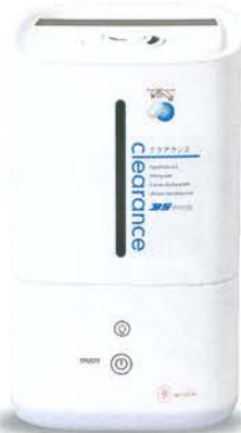
■クリアランス AT-45 39,800円(税別)